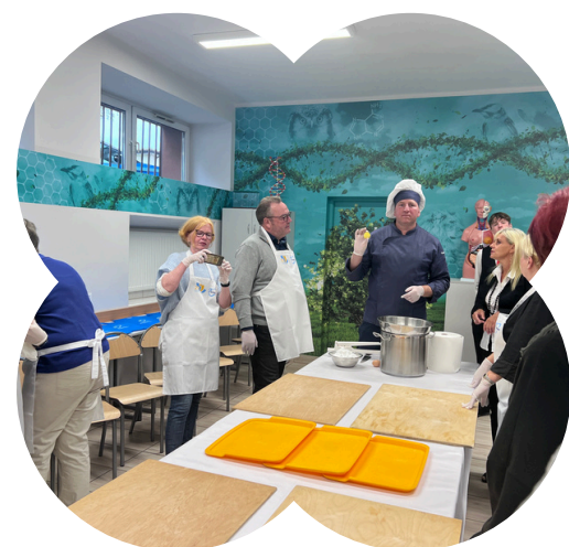
Ważne wydarzenia w życiu szkoły