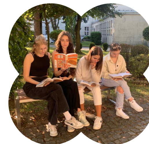
Atrakcyjne formy pozaszkolnego