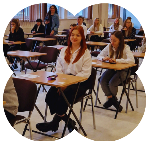
Sukcesy w konkursach i olimpiadach