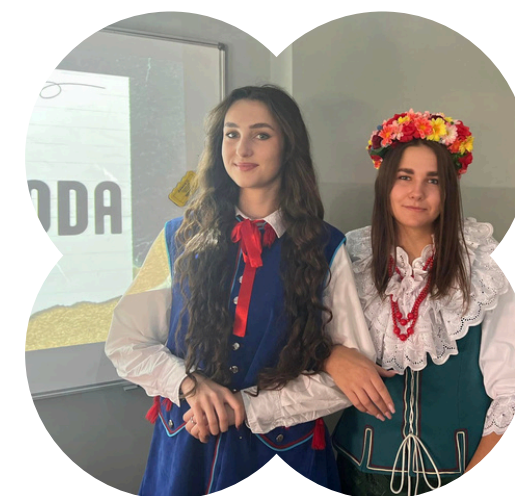
Ciekawe, nieszablone spędzania czasu lekcje