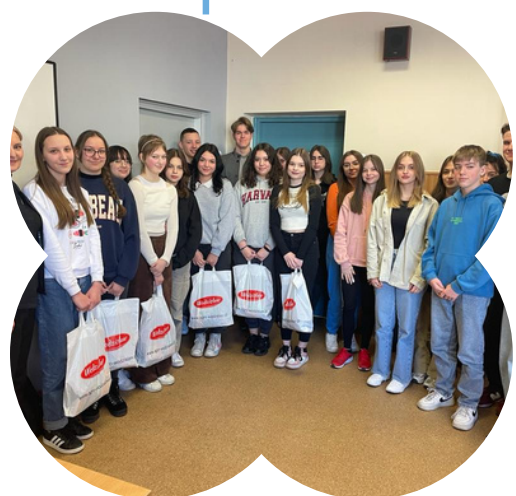
Współpraca z pracodawcami